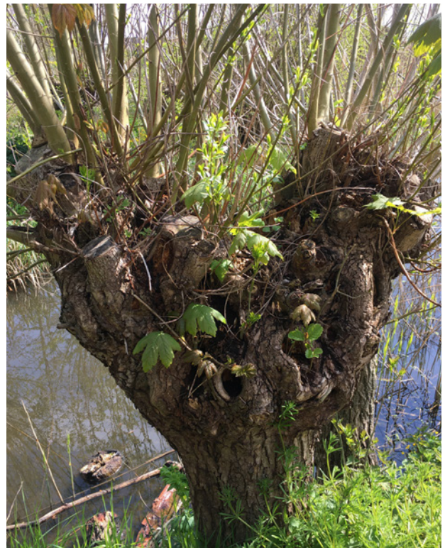
Knotwilg met esdoorn