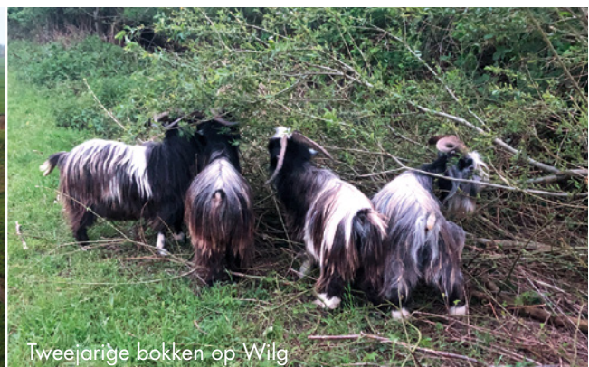
Tweejarige bokken op Wilg