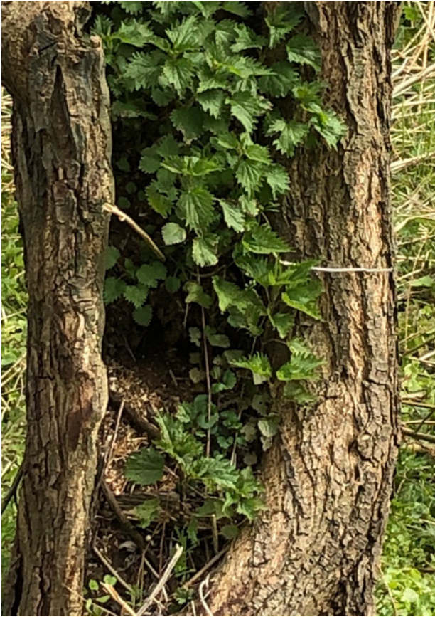
Hondsdrif en brandnetel