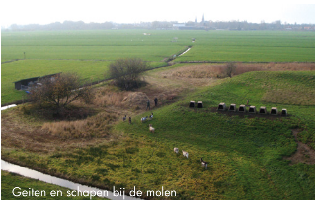
Geiten en schapen bij de molen

Tenslotte is de Nederlandse landgeit een gehard dier dat aangepast is aan de omstandigheden in Noordwest-Europa. Ze hebben een mohair ondervacht met dekharen eroverheen. De mohair blijft droog door de dekharen die het water er af laten lopen. Van kou hebben ze geen last maar ze willen wel graag een droog rustplekje hebben, liefst met uitzicht.