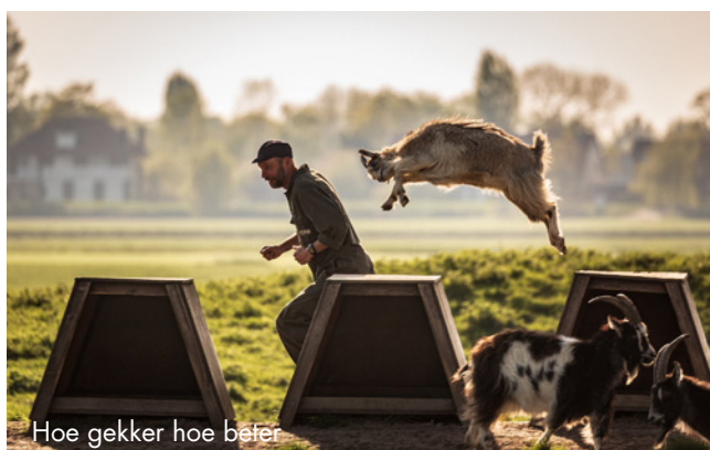
Hoe gekker hoe beter