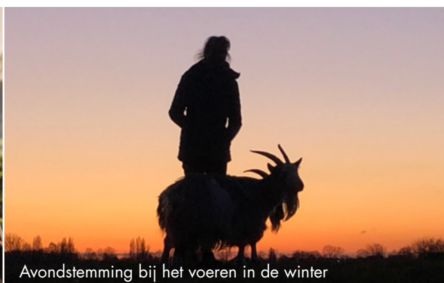
Avondstemming bij het voeren in de winter