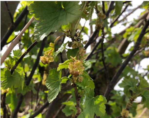
Knotwilg met ribes