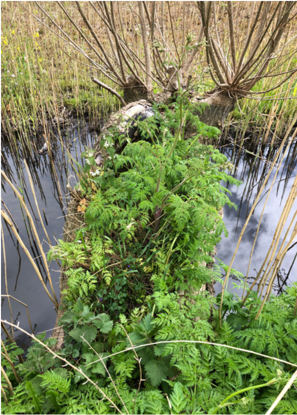
Fluitekruid, brandnetel, hondsdrif en gras.