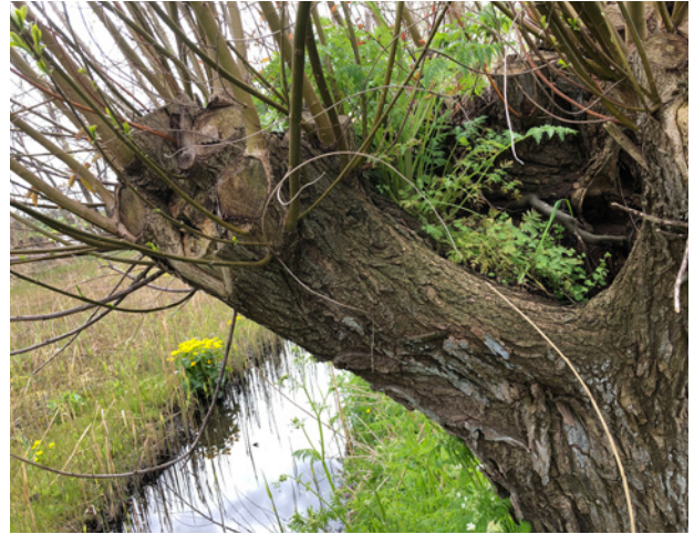
Klimop ereprijs en fluitekruid