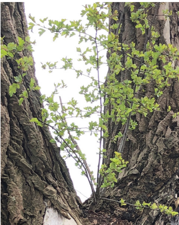
Knotwilg met meidoorn