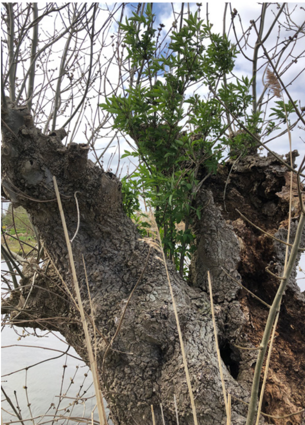
Knot-es met vlier