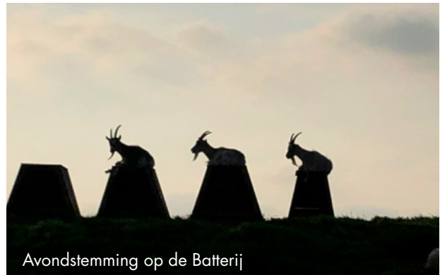
Avondstemming op de Batterij

Browsen is hun natuurlijk graasgedrag. Dit betekent grazen op hoogte. Ze grazen bij voorkeur niet onder de 30cm, tenzij er niks anders is natuurlijk. Hierdoor is extensief grazen met landgeiten goed geschikt om een gras- riet- of zeggeland bloemrijk te houden want alles onder de 30 cm komt gewoon in bloei en overschaduwende gewassen worden weggegeten. Dit is anders dan schapen en runderen die veel meer gras in hun menu hebben en het liefst alles kort weggrazen. De geit is een sociaal en gezellig dier. Ze nemen je makkelijk in hun kudde op en als je dan ergens heen