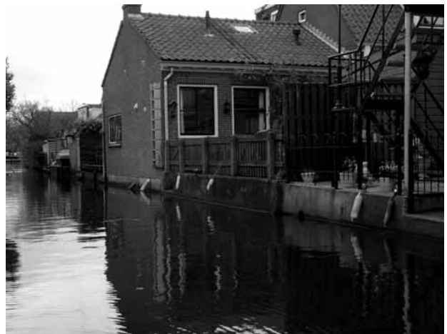
Nauwe Gein zonder bootjes...

De hele uitvoering die Waternet in gang gezet had, bleek te zijn gebaseerd op een besluit dat in 2006 was genomen. Dit besluit, zo blijkt achteraf, heeft ooit op een advertentiepagina in het VAR Nieuwsblad gestaan. Vrijwel niemand is dat opgevallen, en degenen die het wél lazen overzagen de consequenties niet. Sterker nog: indien lezers toentertijd hadden begrepen dat dit kon inhouden dat heel