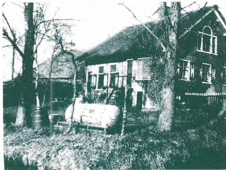
Aansluiting op het aardgasnet: geen oerlelijke gastanks.

probeert maatregelen te verzinnen om het boerenbedrijf rendabel te houden. De werkgroep bestaat - hoe kan het ook anders - voor het grootste deel uit boeren aan het Gein, die gelukkig in grote getale lid zijn van de vereniging. Een van de eerste besluiten van de werkgroep is geweest ervoor te ijveren dat ook het Gein op het