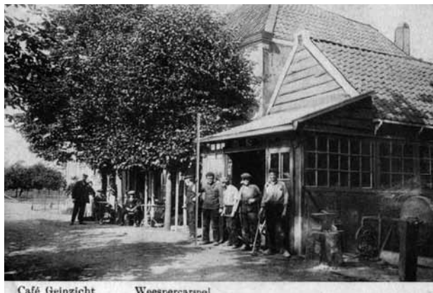
Café Geinzicht Weesperkarspel

Gaan we verder langs Gein Zuid richting Driemond, dan vinden we daar waar het Gein in de Gaasp uitmond, links naast villa Schoonoord, de plek waar de smederij van Fakkeldij en het café 'Geinzicht' ooit stonden. Hier, bij de buurtschap Geinbrug, was een ligplaats voor de beurtschippers die vanuit Weesp