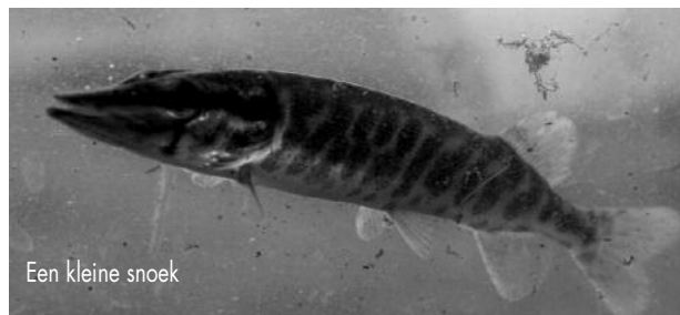
Een kleine snoek