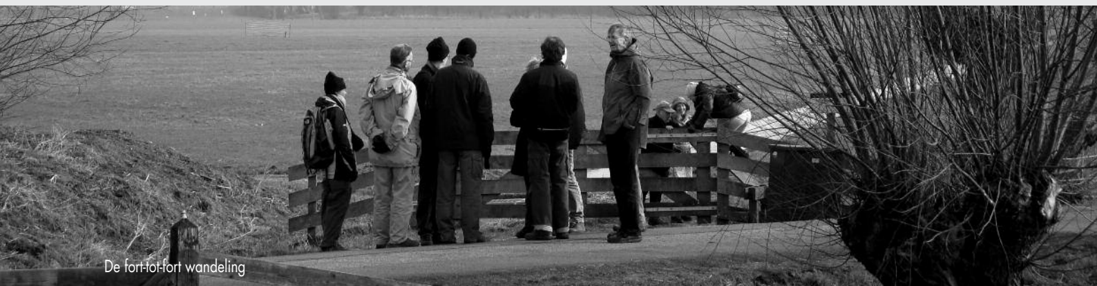
De fort-tot-fort wandeling