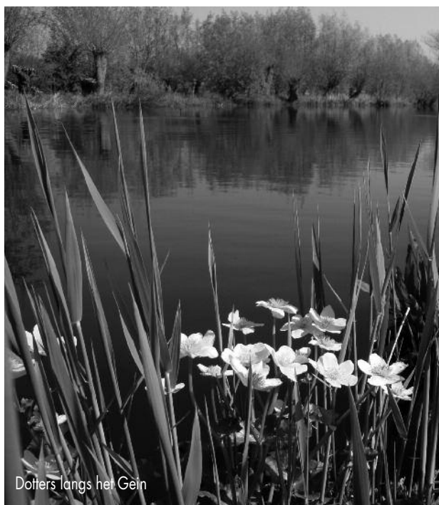
Dotter langs het Gein

(Met dank aan mijn deskundige groepsleden van die avond)