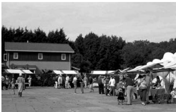
Stadsboerderij Almere tijdens het oogstfeest.