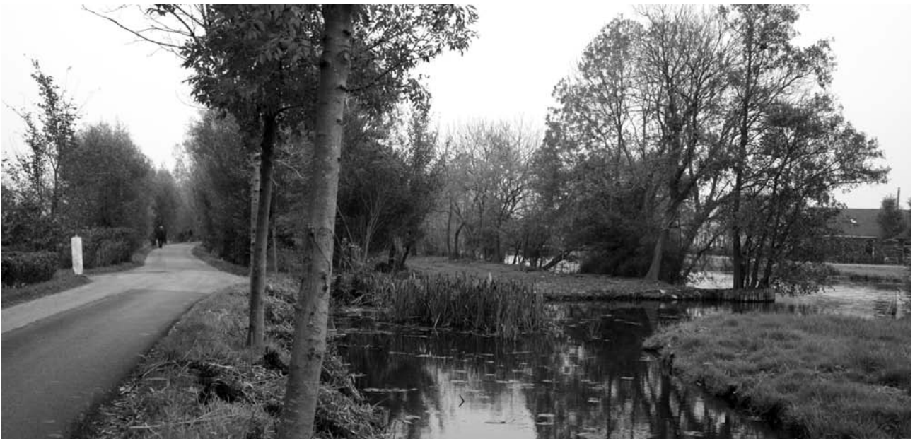
Het oeverland ligt er inmiddels weer prachtig bij.