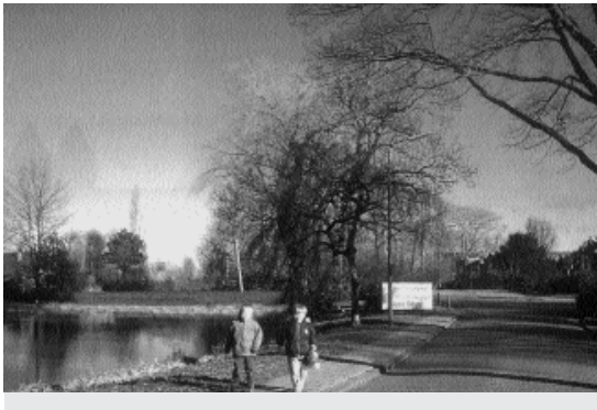
Variant verdiept: Visuele relatie nabij het Gein vanuit de Stationsstraat.

Na de discussie over de varianten bleef het lange tijd stil. Pas in november 1998 kwam er weer beweging in de zaak. In een debat in de Tweede Kamer over infrastructuur dienden Van Heemst (PvdA) en Giskes (D66) een motie in, waarin zij voorstelden om de al jaren omstreden autosnelweg A4 door Midden-Delfland niet aan te leggen en het vrijkomende geld te besteden aan een spoortunnel door Delft en aan verdiepte aanleg van het spoor bij Abcoude. De motie werd aangenomen, met alleen de stemmen van VVD en CDA tegen. Dat was al de vierde keer dat de Kamer zich uitsprak voor verdiepte aanleg. Minister Netelenbos zegde in het debat niets toe. Zou zij net als minister Jorritsma in de jaren daarvoor de kameruitspraak naast zich neerleggen?