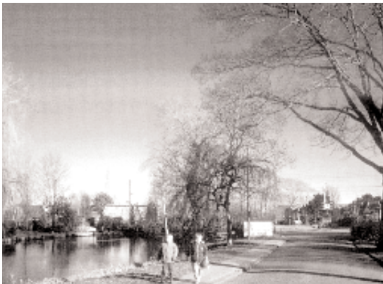
Huidige situatie: Visuele relatie nabij het Gein vanuit de Stationsstraat.

De beslissing is gevallen. De trein gaat onder het Gein. Op 19 februari heeft het Kabinet de knoop doorgehakt, nadat eind vorig jaar voor de vierde maal een meerderheid in de Tweede Kamer haar voorkeur had uitgesproken voor verdiepte ligging van de nieuwe sporen. De beslissing is een formidabel succes voor de gemeenschap in Abcoude. Vele jaren van eensgezind en vasthoudend actievoeren door het College van Burgemeester en Wethouders, de gemeenteraad, de vereniging 'Bescherming Spoorbuurt Abcoude' en de vereniging 'Spaar het Gein' zijn beloond. De kabinetsbeslissing betekent ook een erkenning van de waarden van het Geingebied en het beschermd dorpsgezicht van Abcoude. De gekozen oplossing van de spoorverdubbeling laat die waarden intact. Iedereen die het Geingebied een warm hart toedraagt kan trots zijn op wat nu is bereikt.