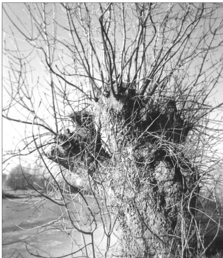
Knot-es aan het Gein

In de Nieuwsbrief nummer 11 was al te lezen welke fraaie vormen geknotte essen aan kunnen nemen. In het desbetreffende artikel werden ook enkele voorbeelden gegeven van dergelijke knot-essen die men in het Gein en aan het begin van de Velterslaan kan vinden. Toch is de es, fraxinus excelsior , (niet te verwarren met de esdoorn!) als knotboom niet zo bekend als de wilg. De Latijnse naam wijst er al op dat dit een boom is die heel hoog kan worden - wel 40 meter hoog! Excelsior betekent namelijk hoger. Het is één van Europa's grootste loofbomen.