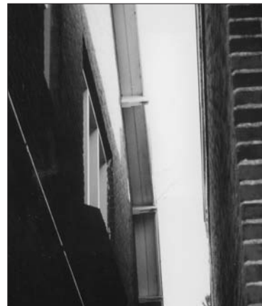
De blinde muur van Rentincks huis en het raam in de gevel daartegenover

die beter verborgen kon worden, en verder had de belanghebbende de grond al gekocht vóór de inwerkingtreding van de verordening. De eerste reden, aldus de burgemeester, was de belangrijkste geweest.