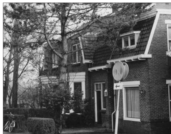
De twee erkers aan Gein Noord, januari 2001

Eveneens in oktober 1924 komt de Geinbebouwing ter sprake in de gemeenteraad van Abcoude-Baambrugge. De vereniging Abcoude's Belang maakt zich zorgen over de ontheffingsmogelijkheid in de