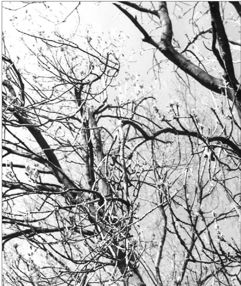
Es met bloemen

monsters, moge blijken uit de Germaanse mythologie waarin verhaald wordt over de wereldboom Yggdrasil: dit was een altijd groene es, de grootste en beste onder de bomen. Zijn takken spreiden zich over de hele wereld uit en reiken zelfs tot in de hemel. Bovenin zit een arend, die de wereld bekijkt; tussen zijn ogen zit een havik, de maker van het weer. Aan de voet van de boom zit een slang of een draak. Een eekhoorntje klimt op en neer en brengt onvriendelijke boodschappen tussen de arend en de slang/draak over en wakkert zo de twist tussen beide aan. Dit eekhoorntje is het symbool van de steeds weer op aarde oplaaiende twisten. De havik als weersvoorspeller levert gezegden op als: "Als de eiken eerder bloeien dan de essen, volgt een natte zomer" - is het andersom dan volgt een droge zomer. In het christendom is de "wereld-es" vermengd met de levensboom.